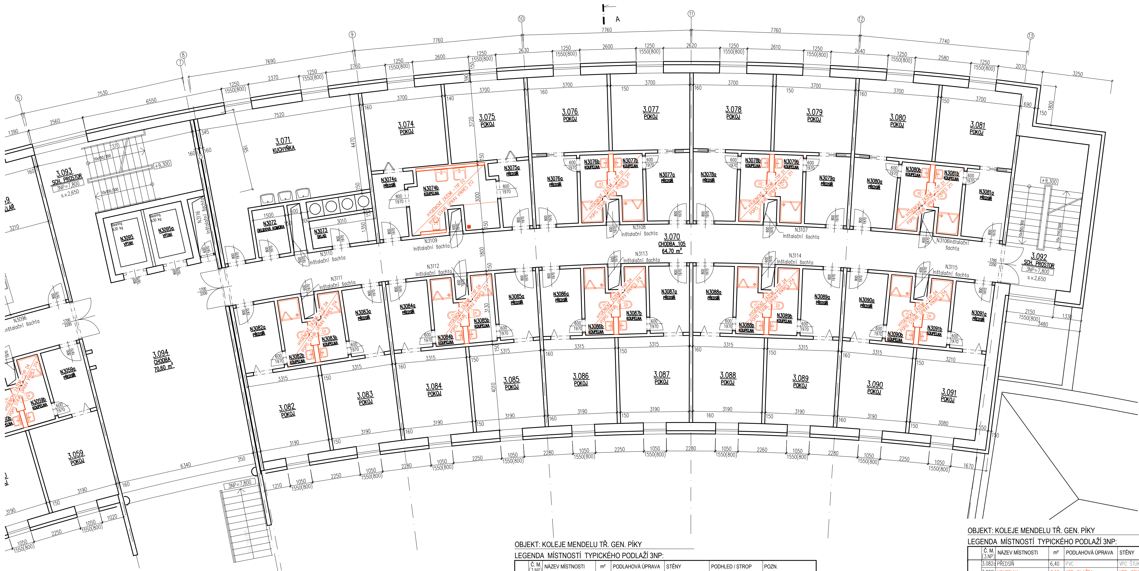
OBJEKT: KOLEJE MENDELU TR. GEN. PÍKY